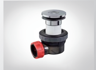
CONJUNTO LAVABO NANO 6.7