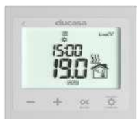
TP 220 ducaheat